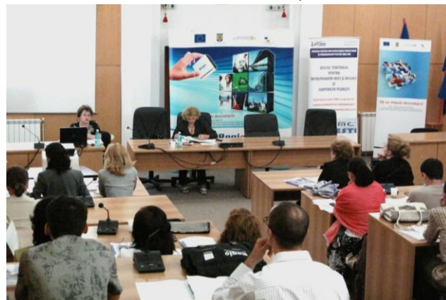
Sala mare de ședințe a Consiliului Județean Călărași, 22 iunie 2010

Agenția pentru Dezvoltare Regională Sud Muntenia va demara o nouă rundă de seminarii pentru a promova oportunitățile de finanțare nerambursabile din Regio pentru mediul de afaceri. Caravana va avea loc în a doua jumătate a lunii iulie 2010 și va viza atât municipiile reședință de județ, cât și orașele mici și mijlocii, astfel încât să fie informat un număr cât mai mare de potențiali beneficiari.