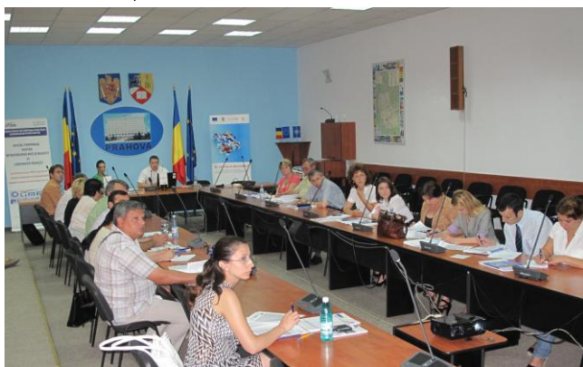
Sala de ședințe a Palatului Administrativ Ploiești, 17 iunie 2010

Scopul organizării acestei runde de seminarii de informare și instruire este de a încuraja procesul de depunere de proiecte eligibile prin care se pot obține fonduri europene nerambursabile Regio pentru dezvoltarea structurilor de sprijinire a afacerilor și a microîntreprinderilor.