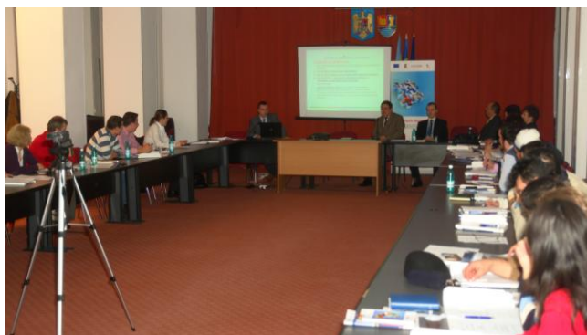
Seminar de informare - Ialomița, 9 februarie 2010

informare pentru potențialii beneficiari de fonduri Regio în toate județele regiunii cu scopul de a promova Axa prioritară 4 „Sprijinirea dezvoltării mediului de afaceri regional și local” (Domeniile majore de intervenție 4.1 „Dezvoltarea durabilă a structurilor de sprijinire a afacerilor de importanță regională și locală” și 4.3 „Sprijinirea dezvoltării microîntreprinderilor”). Pentru a ajunge mai aproape de potențialii beneficiari, întâlnirile de lucru vor fi organizate atât la nivel de municipii reședință de județ, cât și la nivel de orașe mici și mijlocii. În acest sens au fost transmise autorităților publice locale și județene scrisori de solicitare de sprijin pentru organizarea seminarilor.