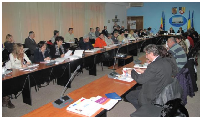
Seminar de informare - Ploiești, 17 februarie 2010

În a doua jumătate a lunii iulie, Agenția pentru Dezvoltare Regională Sud Muntenia va continua runda de seminarii de