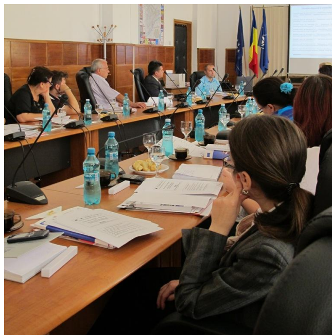
Sala de ședințe a CJ Giurgiu, municipiul Giurgiu, 27 septembrie 2012

Sesiunea de informare destinată beneficiarilor, ce se află la cea de-a doua ediție, este finanțată prin Regio, Axa prioritară 6 „Asistență tehnică”, având ca scop diseminarea rezultatelor implementării Programului Operațional Regional, precum și facilitarea unui schimb de experiență între ADR Sud Muntenia, în calitate de Organism Intermediar pentru Regio, și beneficiarii de proiecte finanțate prin POR 2007 - 2013.