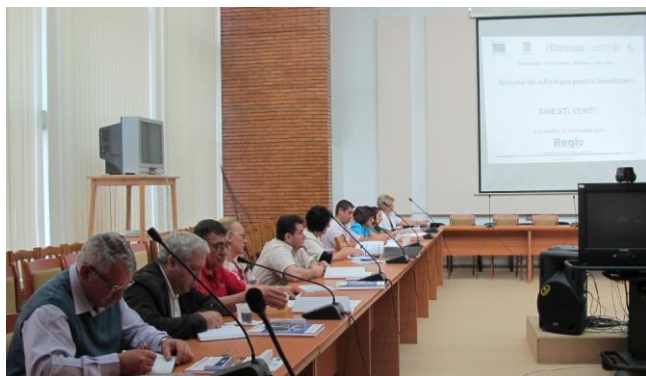
Sala mare de ședințe a CJ Teleorman, municipiul Alexandria, 25 septembrie 2012

Obiectivul organizării acestor evenimente a fost de a sprijini beneficiarii în procesul de implementare a proiectelor finanțate din Regio, dar și de a-i informa despre oportunitățile de finanțare oferite de Fondul Național de Garantare a Întreprinderilor Mici și Mijlocii și despre stadiul pregătirii următoarei perioade de programare, 2014 - 2020. Totodată, au fost oferite informații utile despre posibilitățile de modificare a contractelor, prin notificare sau act adițional, precum și