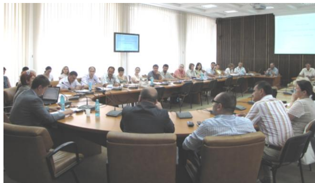
Întâlnire de lucru a membrilor GPL de la nivelul județului Dâmbovița - Târgoviște, 12 iulie 2011

În perioada 12 - 21 iulie a avut loc prima rundă a întâlnirilor de lucru la care au fost invitați să participe membrii Grupurilor de Parteneriat Local (GPL) din regiunea Sud Muntenia. Evenimentele, la care au participat peste 300 de persoane - reprezentanți ai autorităților publice locale, ai direcțiilor deconcentrate, precum și reprezentanți ai Organismelor Intermediare ale celorlalte Programe Operaționale, au avut loc în toate cele șapte județe ale regiunii noastre.