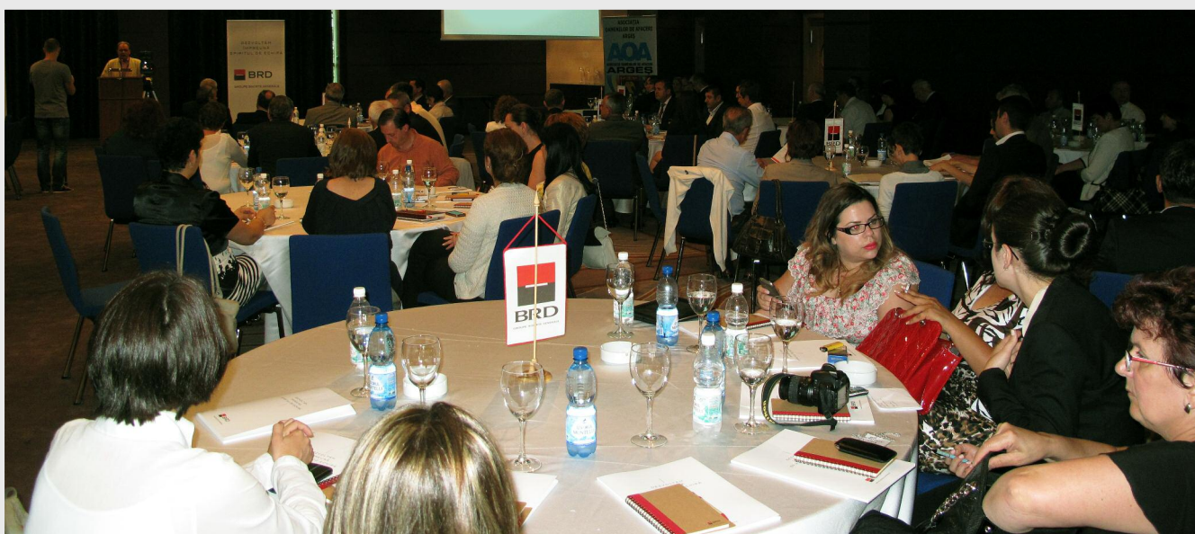
La grupul de lucru au participat autoritășile locale din Argeș, reprezentanși ai mediului privat și ai institușilor bancare, precum și ai mass-mediei argeșene

Una dintre activitășile principale desfășurate de ADR Sud Muntenia este elaborarea Planului de Dezvoltare Regională Sud Muntenia 2014 - 2020, care se realizează în parteneriat, atât la nivel județean, cât și la nivel regional, cu autoritășile publice locale, institușii deconcentrate, mediul academic, mediul privat, patronate/ sindicate, ONG-uri constituite în Comitetul Regional pentru elaborarea planului, Grupuri tematice regionale și Grupuri de parteneriat local.