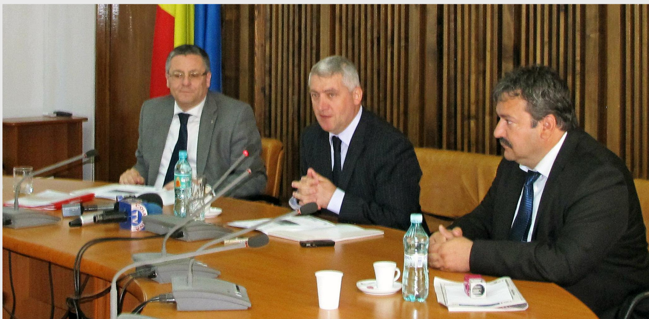
Contractul semnat la sediul Consiliului Județean Dâmbovița are o valoare totală de 7.061.457,96 lei