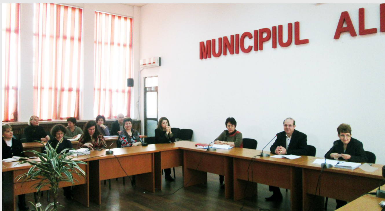
Pentru perioada 2014 - 2020, municipalitatea Alexandria își propune accesarea fondurilor europene pentru 32 de obiective de investiții