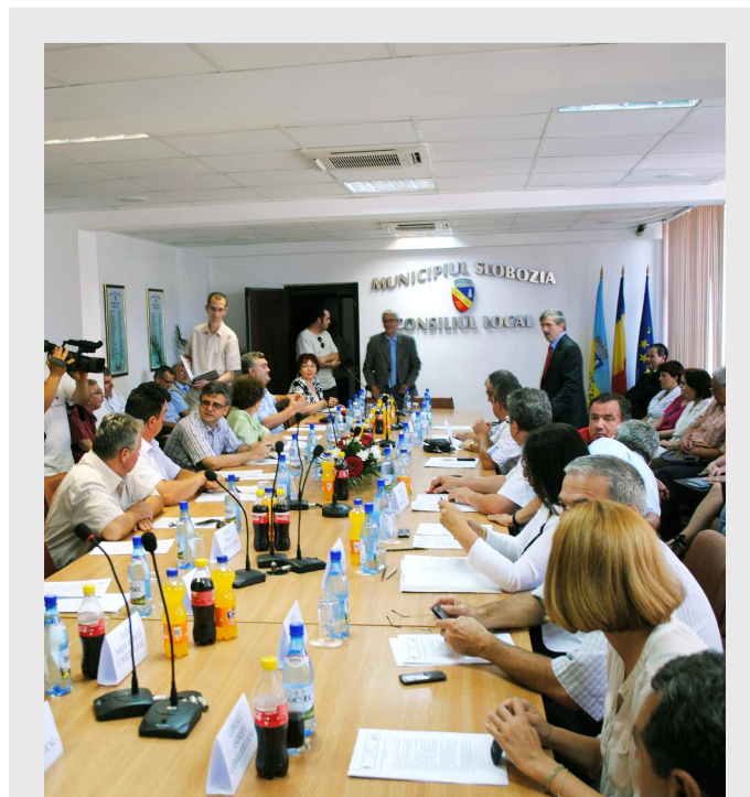
Primăria Slobozia intenționează să construiască un centru pentru persoane fără adăpost la Bora

Una dintre cele mai importante investiții în cartierul Bora a fost Centrul Multifuncțional, inaugurat la sfârșitul anului trecut. Acesta este destinat activităților educative și culturale, beneficiarii participând la lecții de utilizare a calculatorului, programe after school sau de educație sa-