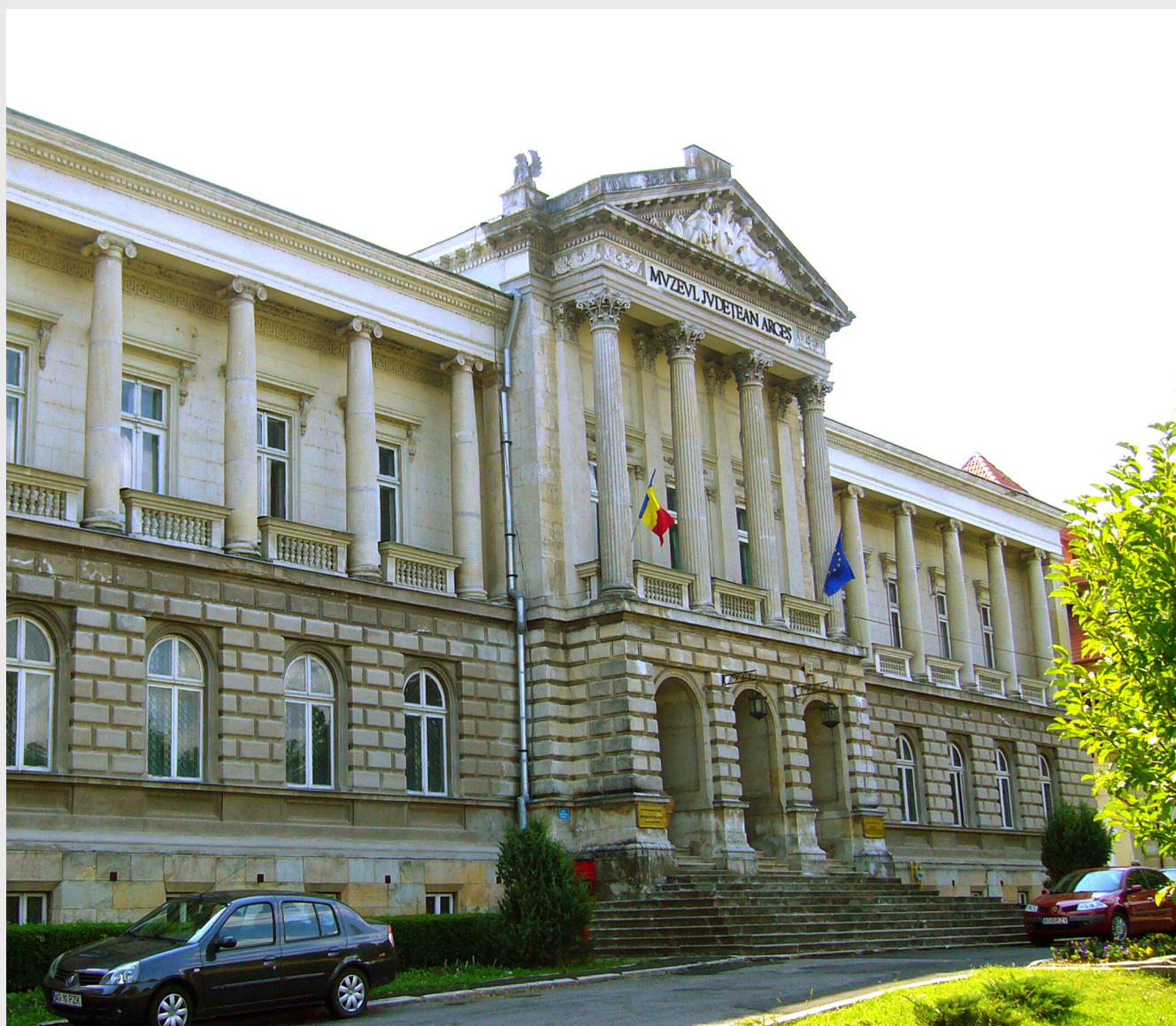
Muzeul Județean Argeș