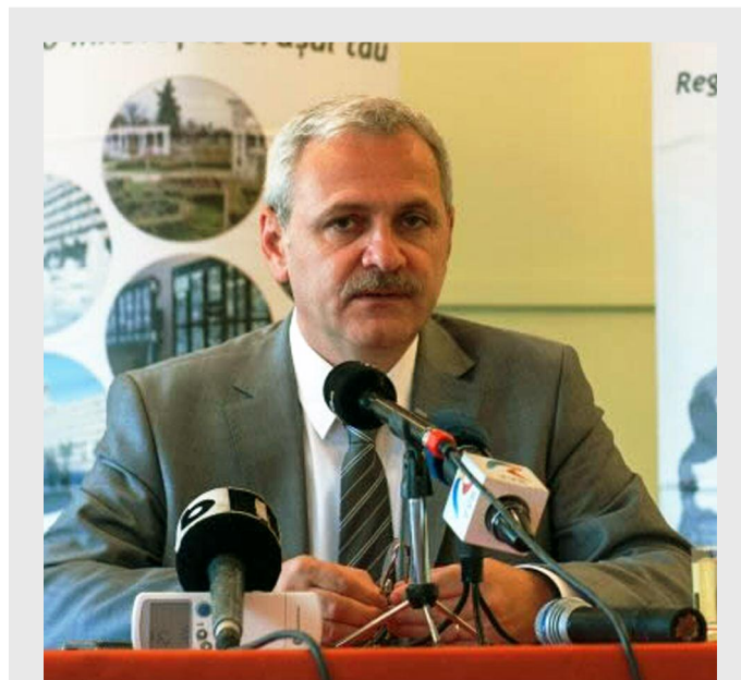
Viceprim-ministrul Liviu Dragnea a afirmat în ședința Comitetului de Monitorizare al Programului Operațional Regional 2007-2013 că „indicatorii care au fost stabiliți pentru POR au fost depășiți cu peste 100%”

Ministrul Liviu Dragnea a anunțat și deciziile adoptate de CMPOR cu privire la realocarea unor sume în cadrul programului. Astfel, suma de 100,8 milioane de euro, rezultată din economii la alte proiecte aflate în implementare și din corecții, va fi realocată de pe axele 1, 3 și 5 pentru finanțarea proiectelor de eficientizare termică a blocurilor de locuințe (Axa prioritară 1, Domeniul Major de In-