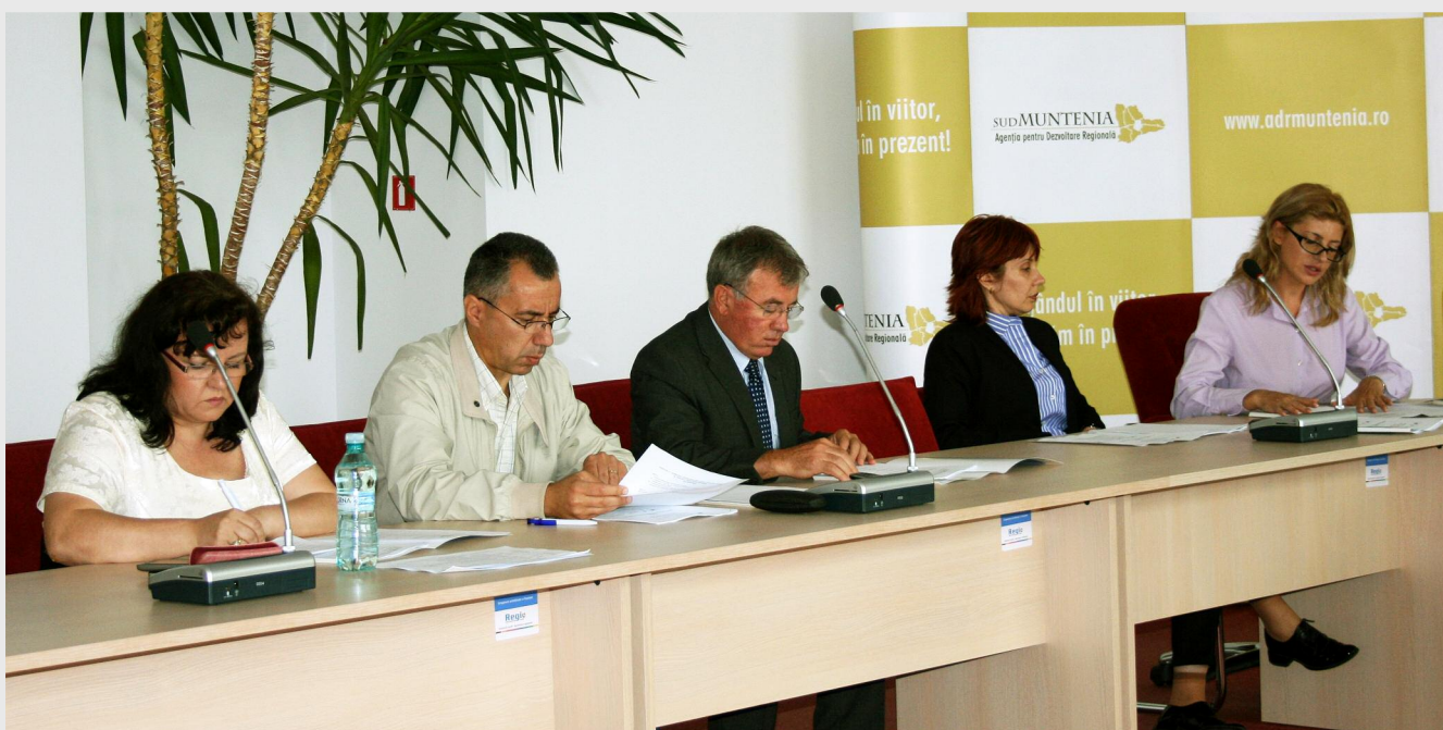
A doua ședință a Comisiei regionale pentru elaborarea criteriilor de selecție a proiectelor strategice s-a desfășurat la sediul Agenției pentru Dezvoltare Regională Sud Muntenia