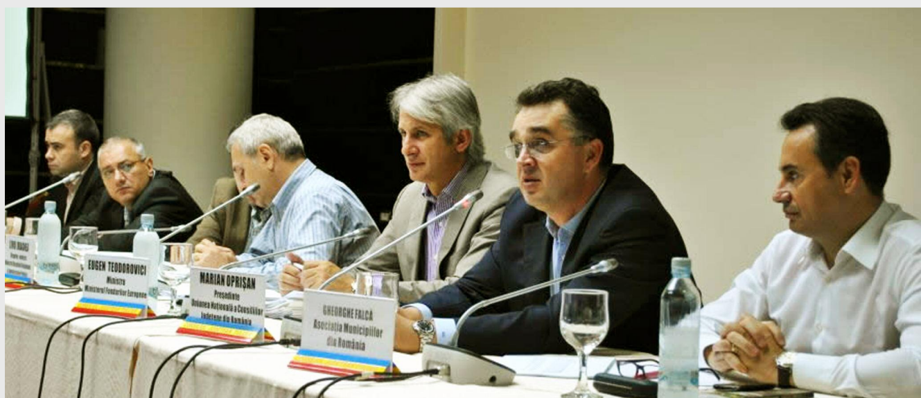
MDRAP organizează în fiecare regiune de dezvoltare dezbateri cu participare publică pentru procesul de regionalizare