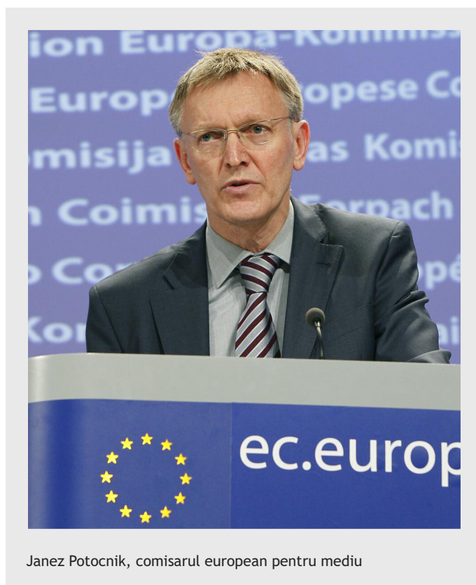
Janez Potocnik, comisarul european pentru mediu

Urmează să fie lansate aproximativ 50 de proiecte din cadrul cererii de propuneri de anul trecut