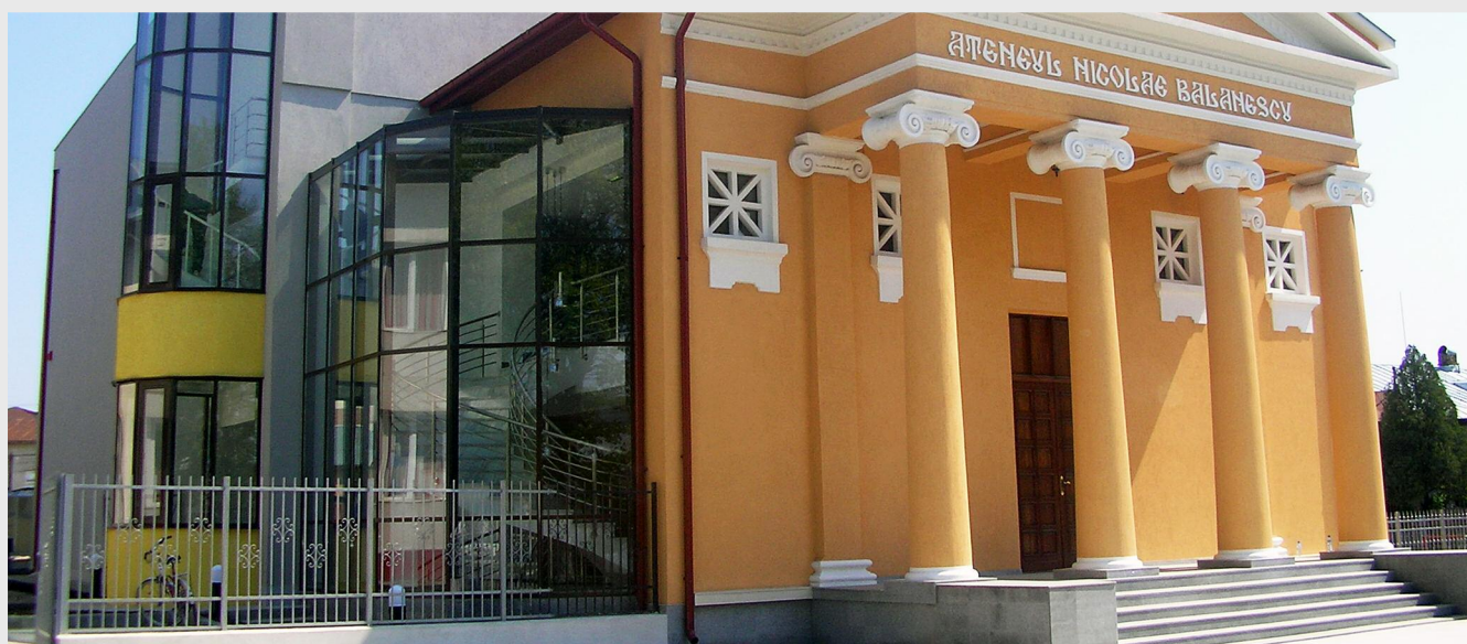
Ateneul „Nicolae Bălănescu” a găzduit prima parte a întâlnirii „Giurgiu pe drumul dezvoltării economice - întâlnire cu mediul de afaceri giurgiuvean”