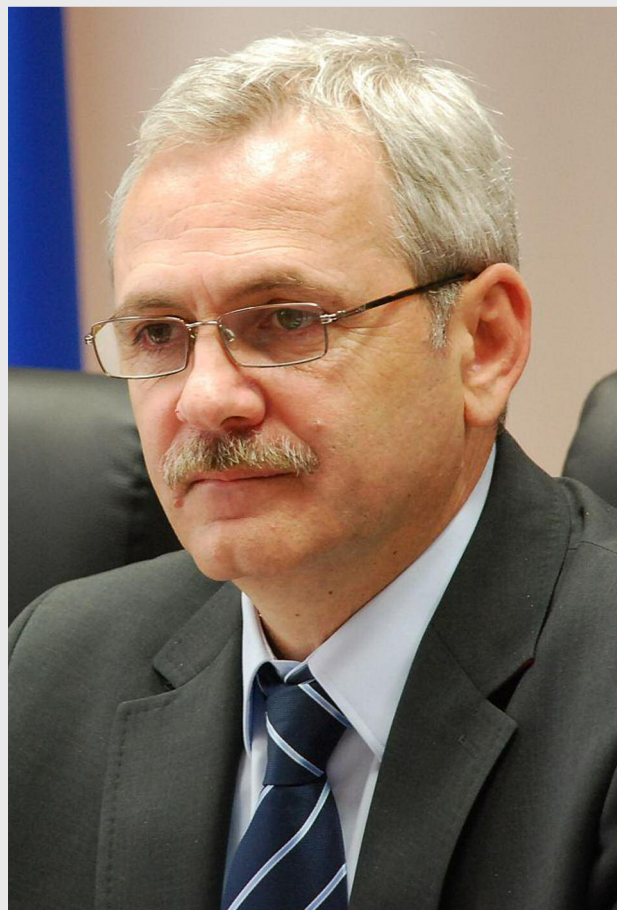
Vicepremierul Liviu Dragnea a afirmat că reședințele viitoarelor regiuni trebuie stabilite după criterii funcționale

Cu privire la propunerile de desființare a comunelor sau județelor, viceprim-ministrul Liviu Dragnea a declarat că se poate discuta despre o asocieră a comunelor, pentru realizarea de proiecte sau interese comune și despre o eventuală comasare a lor instituțională voluntară, după o perioadă de funcționare în asocieră, subliniind: „Comuna, ca