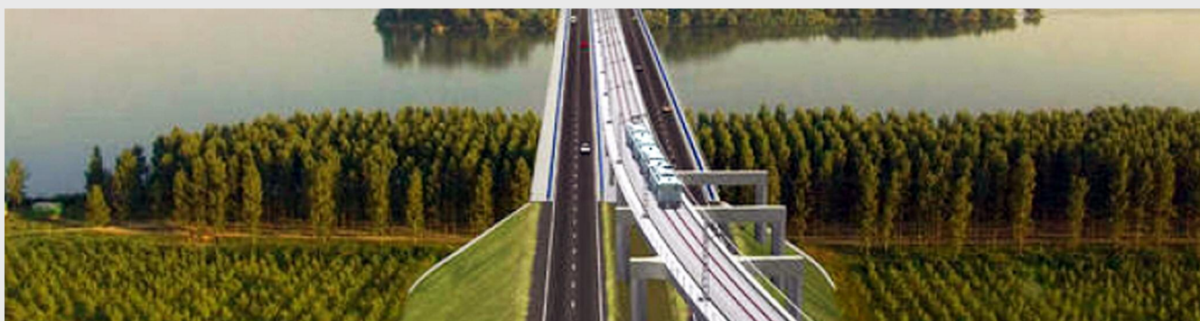
Macheta viitorului pod peste Dunăre