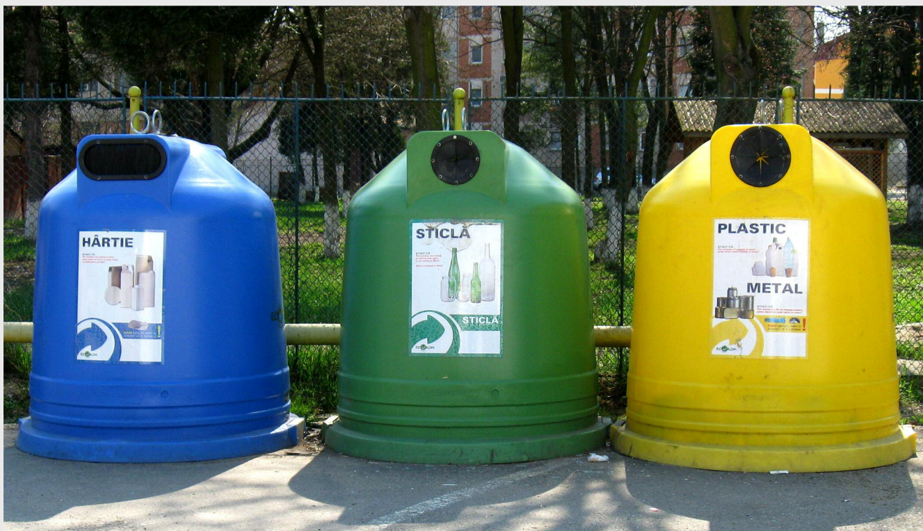
Proiectul „Sistem integrat de management al deșeurilor” are o valoare totală de 21,5 milioane de euro