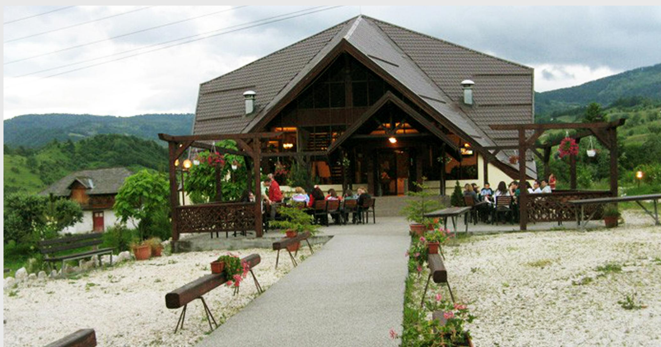
Pensiune din masivul Leaota