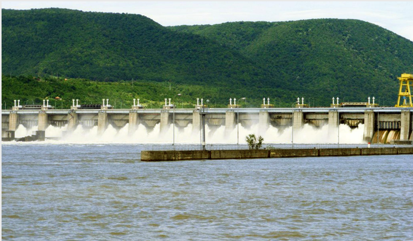
Victor Ponta a dezvăluit faptul că a discutat cu oficialitățile bulgare despre necesitatea unui Proiect de anvergură pentru valorificarea potențialului energetic: hidrocentrală pe Dunăre în zona comunei Seaca