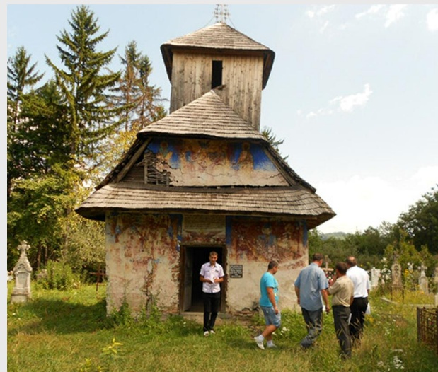
Biserica din Voinești