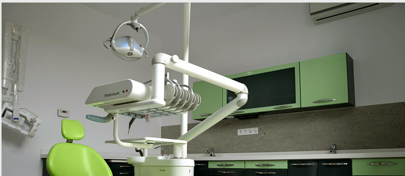
Clinica ELITECITYDENT a fost modernizată prin fonduri FEDR