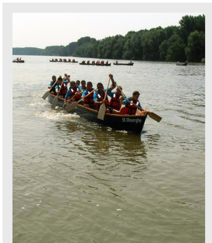
2013 a fost primul an în care au fost organizate evenimente în cadrul Zilei Dunării - ziua peștelui dunărean