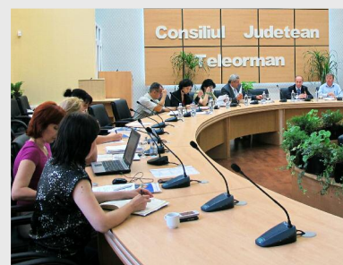
În cadrul ședinței de la Alexandria au fost prezentate grila de evaluare a criteriilor de selecție a proiectelor strategice și stadiul portofoliului regional de proiecte

În cadrul acestui eveniment au fost aprobate minuta ședinței anterioare și Regulamentul de Organizare și Funcționare agreeat de toți membrii comisiei și, totodată, s-au prezentat grila propusă de evaluare a criteriilor de selecție a proiectelor strategice și stadiul portofoliului regional de proiecte.