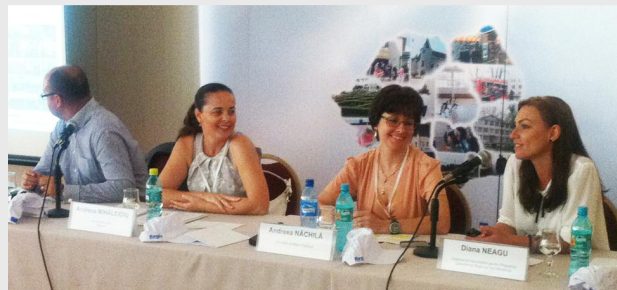
La nivelul ADR Sud Muntenia, cele mai utile instrumente de comunicare au fost vizitele destinate mass-media la proiectele Regio și pagina și contul de Facebook ale Agenției

Începând cu anul 2011, acțiunile de informare și publicitate întreprinse de Agenție s-au axat, în principal, pe promovarea proiectelor de succes prin care comunitățile locale au reușit să se dezvolte în urma investițiilor prin Regio. În acest sens, pentru creșterea gradului de conștientizare a impactului programului în regiunea noastră s-a organizat o serie de evenimente destinate reprezentanților mass-media din Sud Muntenia, ce au constat practic în vizitarea locurilor de implementare a proiectelor derulate în județele din Sud Muntenia (Argeș, Călărași, Dâmbovița, Giur-