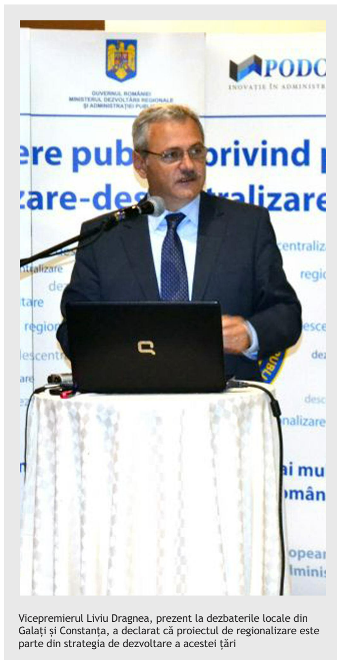
Vicepremierul Liviu Dragnea, prezent la dezbaterile locale din Galați și Constanța, a declarat că proiectul de regionalizare este parte din strategia de dezvoltare a acestei țări

Dezbaterile de la Galați și Constanța privind procesul de regionalizare - descentralizare fac par-