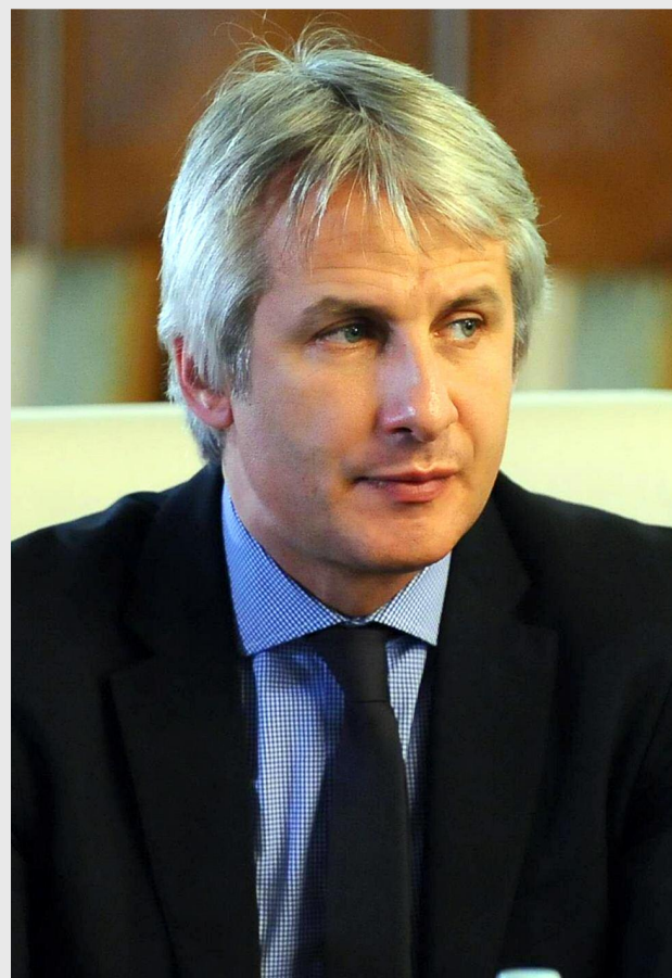
Eugen Teodorovici, ministrul fondurilor europene

„Este firesc ca firmele care supervizează im-