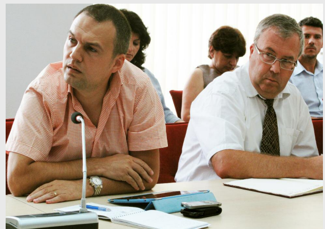
Beneficiarii de fonduri nerambursabile Regio, prezenți în număr mare, au fost informați despre noutățile aduse de Instrucțiunea 105, privind implementarea mecanismului decontării cererilor de plată

Cu această ocazie, beneficiarii au putut să-și clarifice diferite probleme cu care se confruntă în procesul de implementare a proiectelor derulate cu sprijin financiar nerambursabil Regio.