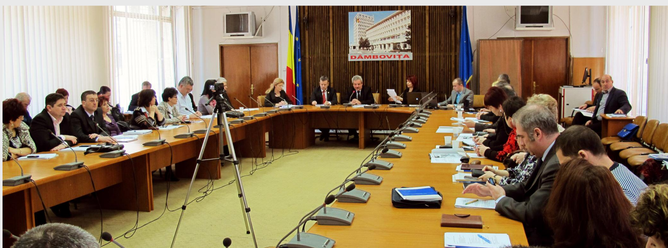
Ședințele destinate Grupurilor de Parteneriat Local se vor desfășura în fiecare județ al regiunii