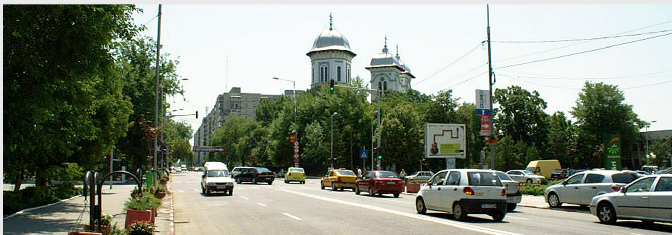
Centrul municipiului Alexandria