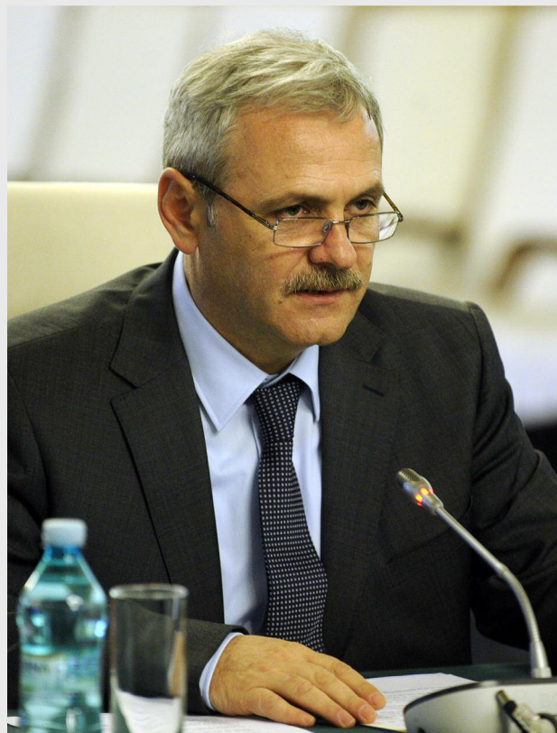
Vicepremierul Liviu Dragnea

„Și recensământul este un încă un argument în plus pentru ca regiunile să fie înființate cât mai rapid, pentru a putea echilibra și stabiliza această rețea de dezvoltare de care am mai vorbit. (...) Numai așa se poate opri migrația spre centrele dezvoltate și, pe de altă parte, plecarea din țară”, a susținut Dragnea.