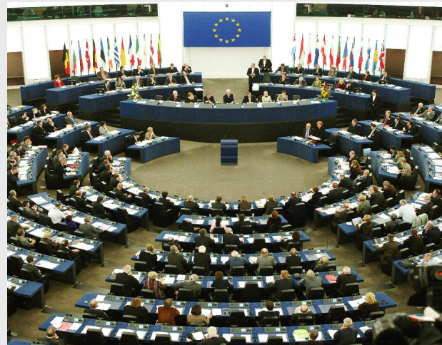
Plenul Parlamentului European

Consiliul a afirmat că își va ține promisiunea de a achita plățile rămase pentru 2013, estimate la 11,2 miliarde de euro. Miniștrii economiei și ai finanțelor