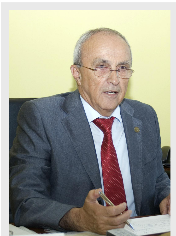
Mircea Cosma, președintele Consiliului pentru Dezvoltare Regională Sud Muntenia