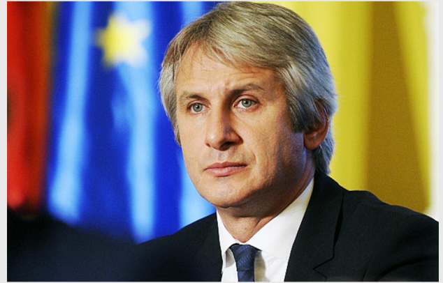
Eugen Teodorovici, ministrul fondurilor europene

„Votul exprimat de Comisia pentru Dezvoltare Regională a Parlamentului European este extrem de important, aceasta fiind Comisia de specialitate a Parlamentului European. Pentru ca regula „N+3” să se aplice, decizia luată de Comisia pentru Dezvoltare Regională trebuie să fie confirmată, în octombrie a.c., de votul final în Plenul Parlamentului European. După aprobarea de către Parlamen-