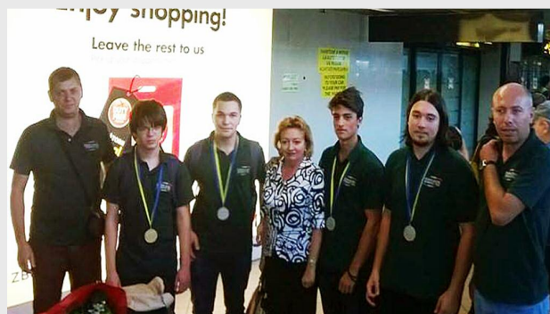
Lotul Român de Informatică, la Balcaniada de la Sarajevo