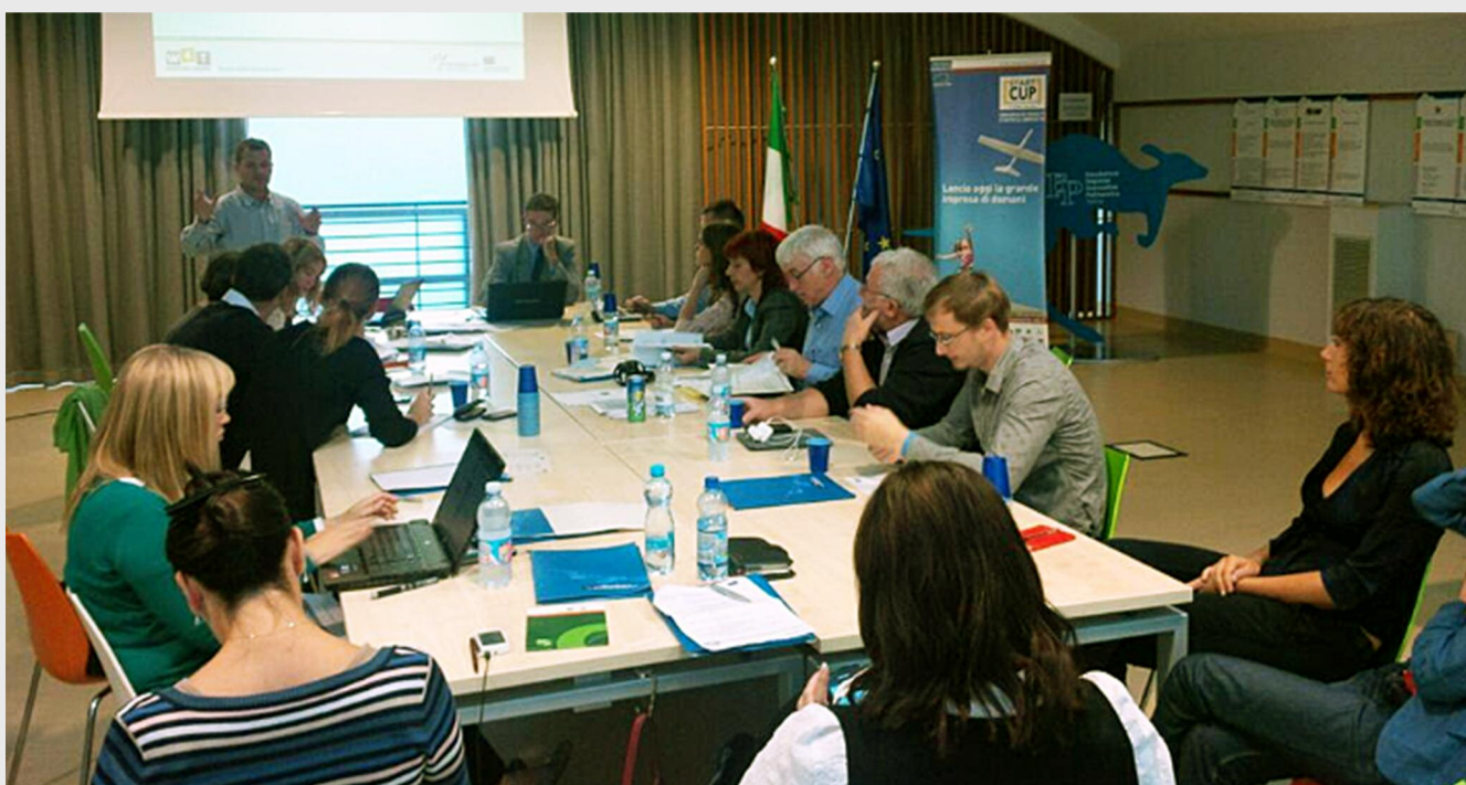
ADR Sud Muntenia a participat ca partener la cea de-a șasea întâlnire a Comitetului de Coordonare a Grupului de Lucru în cadrul proiectului Working4Talent