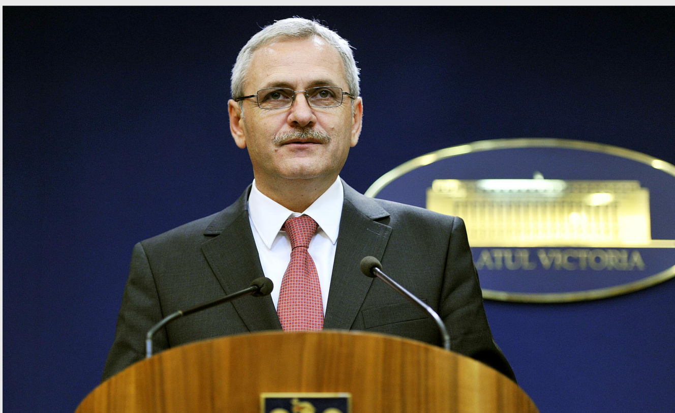
Livi Dragnea, ministrul dezvoltării regionale și administrației publice