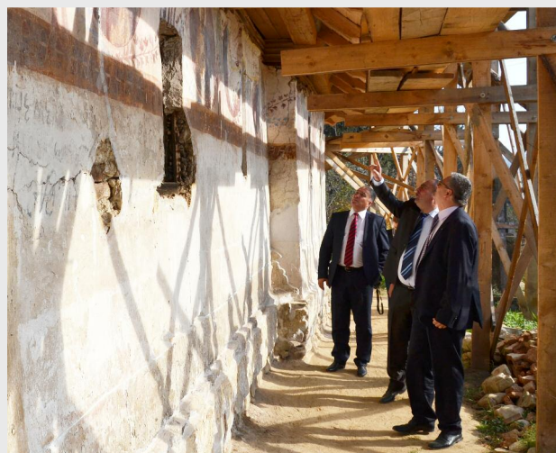
Biserica din lemn „Duminica Tuturor Sfinților”, „Sf Ioan”

Cel de-al doilea eveniment destinat mass-mediei din Sud Muntenia a avut loc în județul Dâmbovița, unde au fost prezentate jurnaliștilor cinci pro-