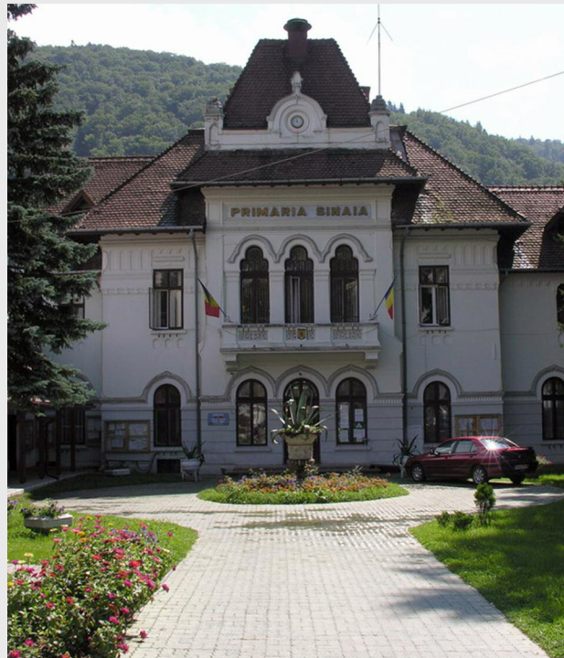
Primăria Municipiului Sinaia