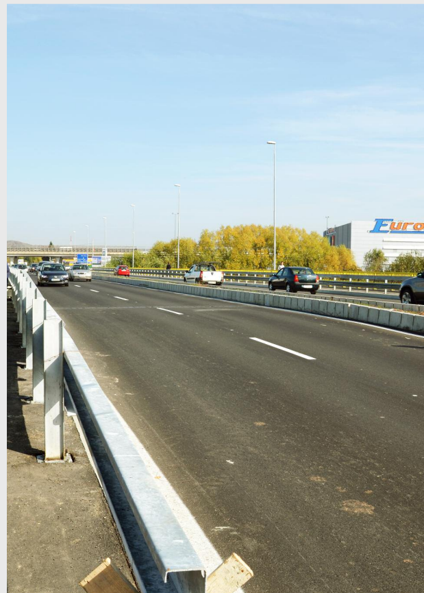
Podul Argeș, Pitești