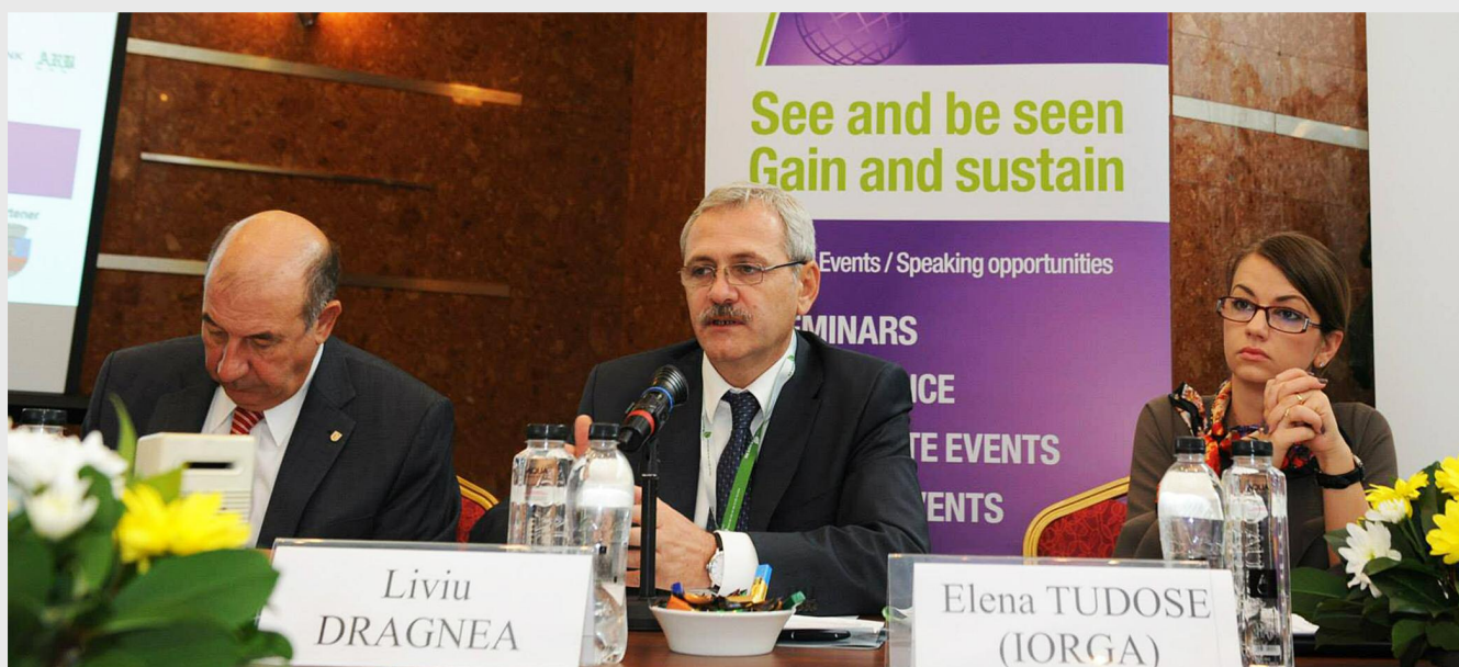
Liviu Dragnea, vice-premierul României: „Trebuie să începem să gândim regional”