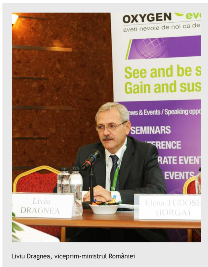
Liviu Dragnea, viceprim-ministrul României

Tot în legătură cu dezvoltarea regională, viceprim-ministrul a menționat că, în viitoarea programare financiară europeană multianuală (2014 - 2020), va fi stimulată asocierea între localități, astfel în-