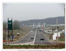
Mioveni: un pod și străzile europene