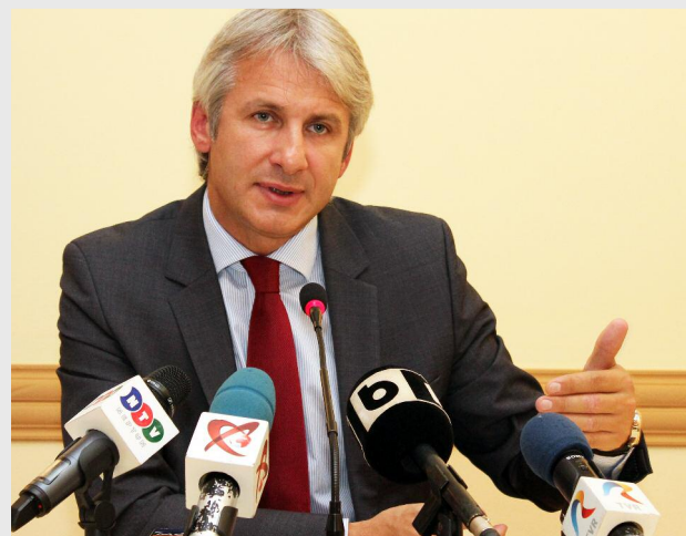
Eugen Teodorovici, ministrul fondurilor europene

În perioada ianuarie - 7 noiembrie a.c., prin Programul Operațional Regional fost rambursată cea mai mare sumă - peste 726 milioane de euro. Pe locul al II-lea se clasează Programul Operațional Sectorial Dezvoltarea Resurselor Umane pentru care au fost rambursate fonduri în valoare de peste 625 milioane de euro. Prin Programul Operațional Sectorial Transport a fost returnată României o sumă de peste 514 milioane de euro, prin Programul Operațional Sectorial Mediu - peste 511 milioane