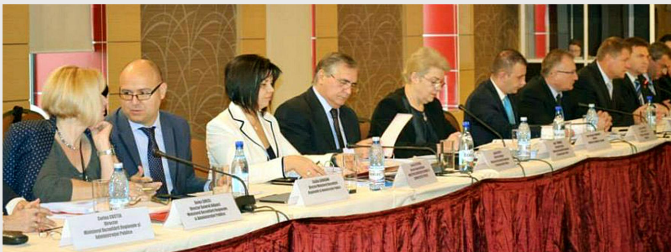
Programul Operațional Regional are cea mai bună rată de absorbție a fondurilor și de respectare a indicatorilor