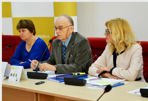
Cel de-al doilea atelier de lucru, organizat în parteneriat de ADR Sud Muntenia și ENERO, a fost destinat autorităților publice locale

În cadrul discuțiilor au fost abordate următoarele teme: