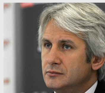
Eugen Teodorovici, ministrul fondurilor europene