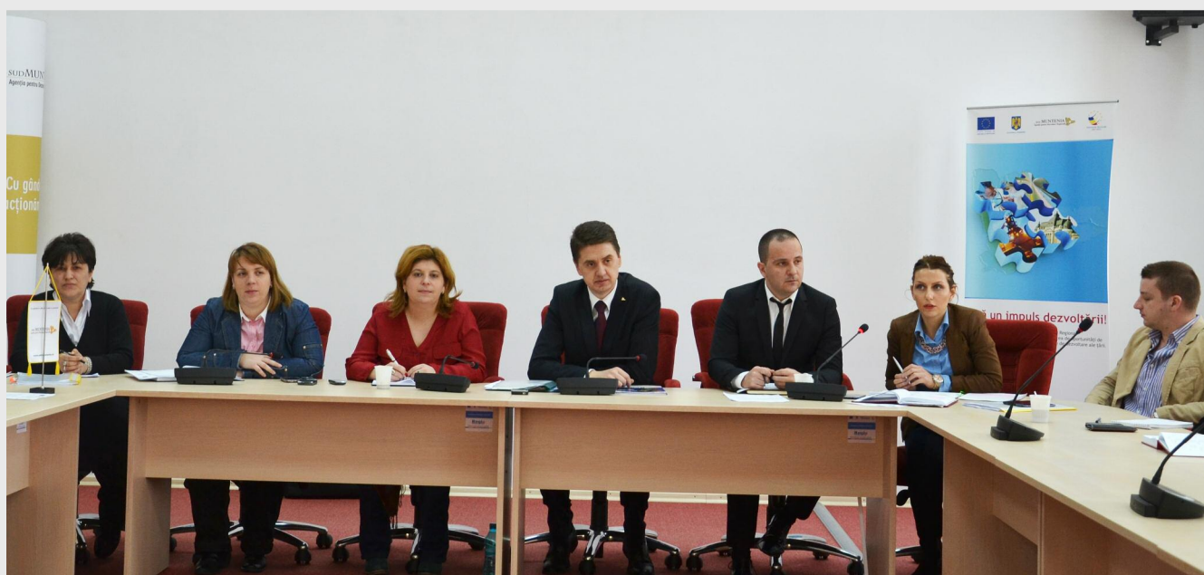
Reprezentanții ADR Sud Muntenia au oferit beneficiarilor de fonduri POS CCE informații despre modul în care trebuie implementate corect proiectele pentru care au obținut finanțare