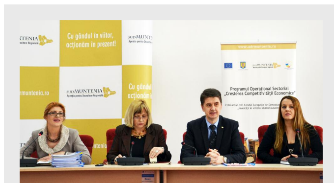
În cadrul conferinței de presă au fost semnate 13 contracte de finanțare care vizează achiziționarea de echipamente și utilaje și crearea a 190 de noi locuri de muncă

Până în data de 5 februarie, la sediul Agenției au fost depuse 192 de cereri ce au fost propuse spre finanțare în urma procesului de evaluare desfășurat în cadrul celorlalte Agenții pentru Dezvoltare Regională și a Autorității de Management pentru POS CCE. Finanțarea nerambursabilă se acordă în cadrul Axei prioritare 1 - Un sistem de producție inovativ și ecoeficient , DMI 1.1 - Investiții productive și pregătirea pentru competiția pe piață în special a IMM-urilor , Operațiunea a) Sprrijin pentru consolidarea și moder-