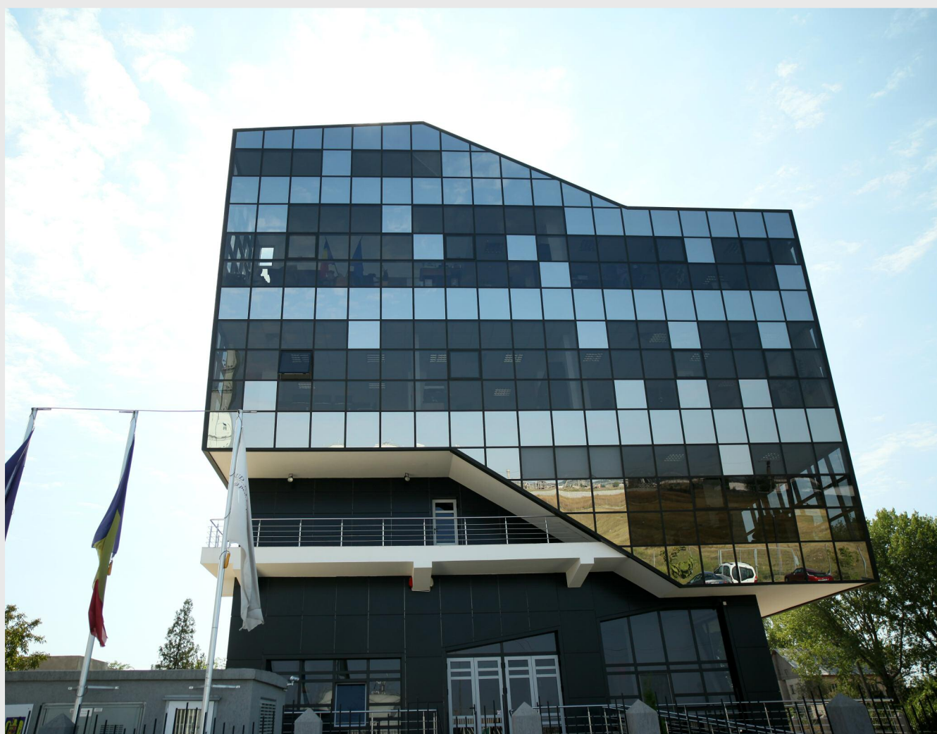
Sediul ADR Sud Muntenia