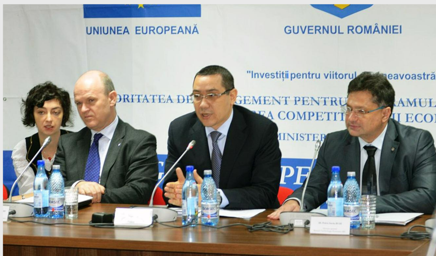
La evenimentul semnării contractelor pentru Polul AUTO MUNTENIA a fost prezent și primul ministru Victor Ponta

ADR Sud Muntenia a devenit, începând de luna trecută, membră în Consiliul Director, prin semnarea actului adițional pentru acordul de parteneriat privind pachetul integrat de proiecte al Polului AUTO MUNTENIA. Promotorii constituirii polului de competitivitate în domeniul automobilelor sunt SC Renault Technologie Roumanie SRL și SC Automobile Dacia SA.