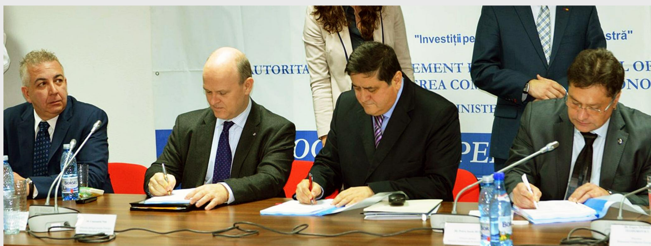
Contractele pentru Polul AUTO MUNTENIA au fost semnate la sediul Autorității de Management a POS CCE