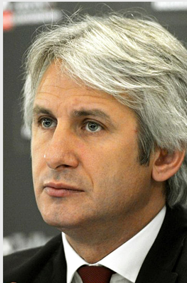
Eugen Teodorovici, ministrul fondurilor europene

„Urmărim crearea unui sistem la standarde europene și vă reamintesc că astfel de măsuri au