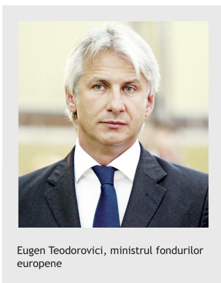
Eugen Teodorovici, ministrul fondurilor europene

„Am publicat toate aceste documente de programare, deoarece Ministerul Fondurilor Europene pune accentul pe o consultare publică extinsă. Cea de-a doua versiune a Acordului de Parteneriat 2014 - 2020 este pe site-ul