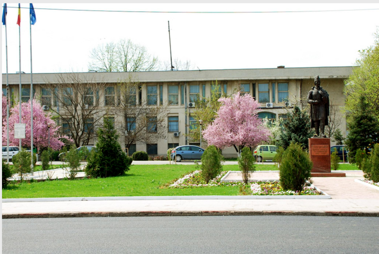
Consiliul Județean Teleorman