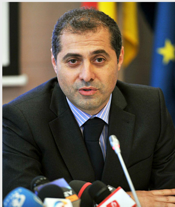
Florin Jianu, ministrul delegat pentru IMM-uri și turism

„Pentru a aplica sintagma ‘România, destinație sigură’ vom avea evenimente în Bucovina”, a spus Jianu care a arătat că, în colaborare cu CJ Suceava se vor organiza infotrip-uri cu mass-media, cu factorii decidenți, cu oameni din industrie din Republica Moldova, pentru a cunoaște mai bine această zonă apropiată atât de Ucraina, cât și de Republica Moldova, astfel încât fluxul de turiști să crească în zonă. Totodată, vor exista târguri la care județul Suceava este invitat să participe, dar și alte evenimente pentru a defini conceptul „România,