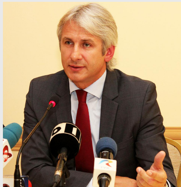
Eugen Teodorovici, ministrul fondurilor europene

De asemenea, în cadrul reuniunii s-a discutat și despre extinderea eligibilității cheltuielilor efectuate în perioada de programare 2007 - 2013. Această idee este susținută de Slovacia, dar beneficiază și de sprijinul altor state membre. În ceea ce privește perioada de programare 2014 - 2020, având în vedere constrângerile bugetare, trebuie să luăm măsuri urgente pentru a începe, cât mai repede, implementarea fondurilor alocate pentru