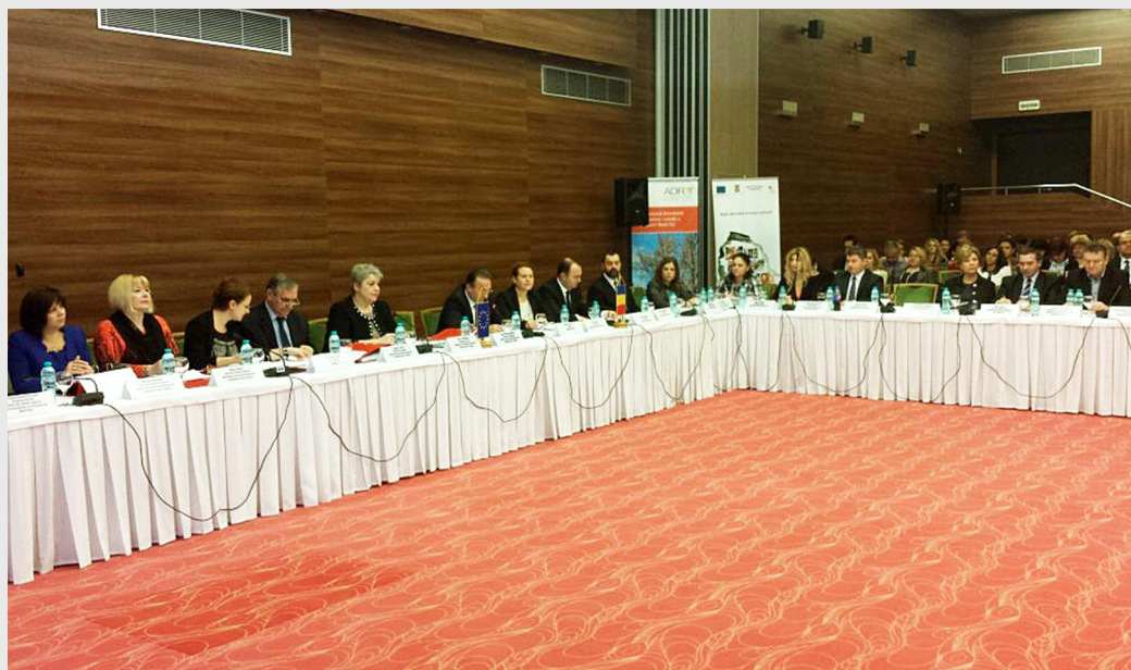
Reuniunea Comitetului de Monitorizare a Programului Operațional Regional

Buletin Informativ nr. 203 / 17 - 23 noiembrie 2014