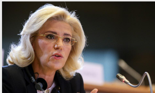
Corina Crețu, comisarul european pentru Politici Regionale

Întrucât România este țara cu cei mai mulți copii abandonati din Europa (în fiecare zi, în România este abandonat un copil), Comisia urmărește cu mare atenție