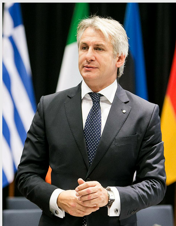
Eugen Teodorovici, ministrul fondurilor europene

Pentru plățile către beneficiarii POS DRU a