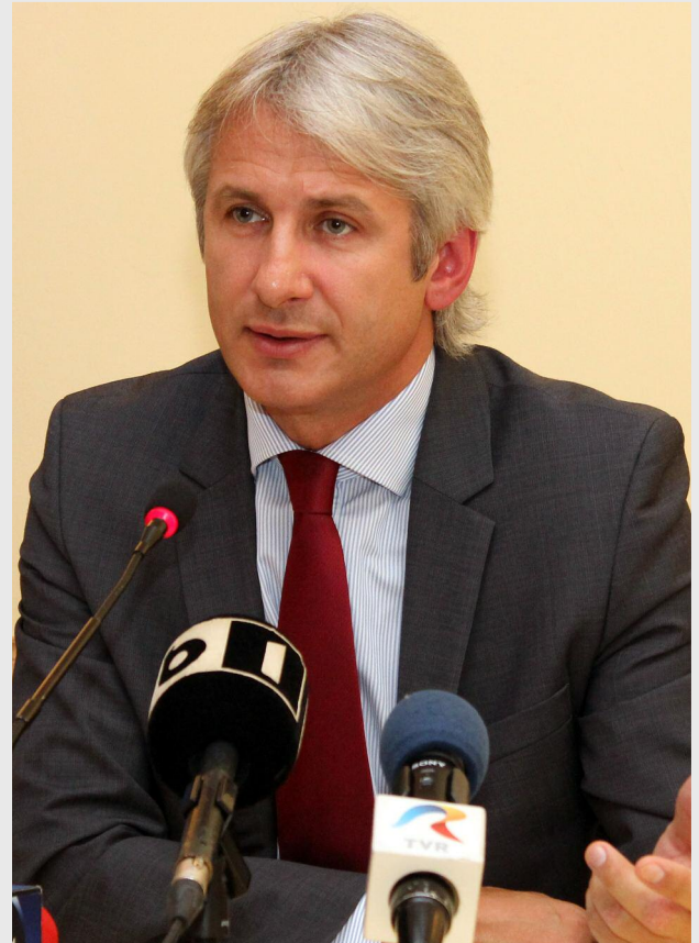
Eugen Teodorovici, ministrul fondurilor europene

Eugen Teodorovici: E adevărat. Anul trecut am lansat primele ghiduri de proiecte pentru următorul cadru financiar 2014 – 2020. Primul a fost cel de capital uman adresat tinerilor pentru primele 2 axe