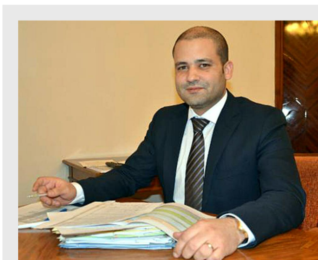
George Turtoi, secretar de stat în Ministerul Agriculturii și Dezvoltării Rurale

Măsura privind investițiile în ferme are alocată o sumă totală pentru perioada de programare de 7 ani de 892,32 milioane de euro, inclusiv contribuția națională de 134,35 milioane de euro, iar măsura dedicată tinerilor fermieri, aproape 445 milioane de euro, din care 44,5 milioane de euro reprezintă contribuția națională. Programul LEADER, dedicat Grupurilor de Acțiune Locală are prevăzută o sumă de 2,16 milioane de euro pentru elaborarea strategiei și zonei.