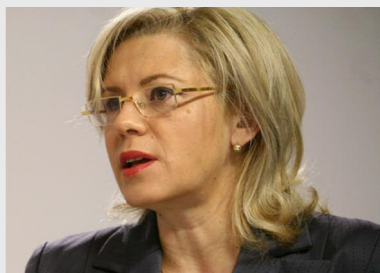
Corina Crețu, comisarul european pentru Politică Regională

„Am trimis echipe de la nivelul DG Regio în toate aceste opt țări. Avem opt țări cu rata de implementare sub 60% și vom face tot ce putem pentru a le ajuta, să găsim căi pentru a mări rata de ab-