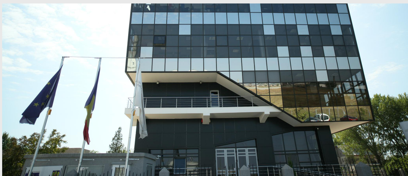
Sediul ADR Sud Muntenia