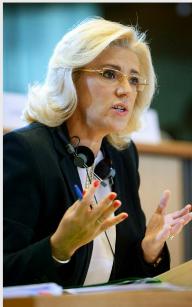
Corina Crețu, comisarul european pentru politici regionale

Inițiativa PEER 2 PEER a fost prezentată oficial