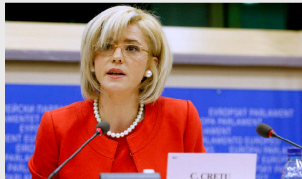
Corina Crețu, comisarul european pentru Politica Regională

Corina Crețu, comisarul european pentru Politica Regională, a declarat: „Sunt încântată să adopt acest program. Acesta a fost conceput pentru a contribui în mod direct la punerea în aplicare cu succes a Strategiei UE pentru regiunea Dunării, prin intermediul priorităților sale tematice și al sprijinului pentru guvernarea strategiei. Programul ar trebui să ajute țările implicate să dezvolte proiecte cu rezultate tangibile și pozitive, care să le permită să rămână în continuare atractive ca loc de viață, studiu, muncă, precum și pentru turism și investiții”.