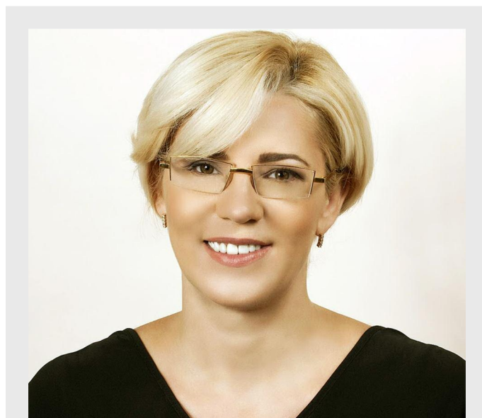
Corina Crețu, comisarul european pentru politică regională

„De exemplu, în perioada 2014 - 2020, 121 de miliarde de euro vor fi investiți în cercetare și inovare; 2 milioane de întreprinderi vor primi finanțare europeană pentru a deveni mai competitive; 14 milioane de locuințe vor fi conectate la rețeaua de internet de mare viteză; 7.500 de kilometri de cale ferată vor fi realizați, din care 5.200 de kilometri în cadrul rețelei TEN-T; 10 milioane de șomeri vor fi sprijiniți să își găsească locuri de muncă, alte 3 milioane de cetățeni europeni vor putea să obțină o calificare în muncă, iar 40 de milioane de persoane vor beneficia, la sfârșitul perioadei, de servicii me-