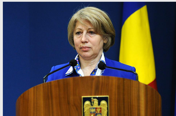
Aura Răducu, ministrul fondurilor europene