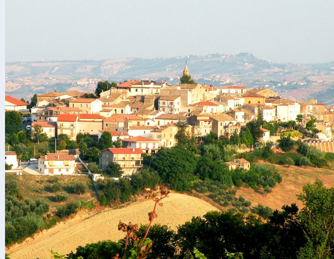
Notaresco, regiunea Abruzzo, Italia

Persoană și date de contact: Municipality Notaresco, website: www.comune.notaresco.te.it , adresa: Via Castello, 6, Notaresco (TE), Abruzzo, Italy, postcode: 64024.