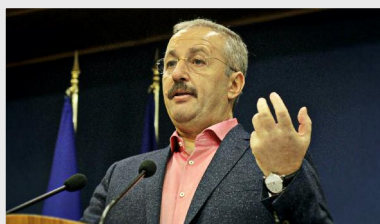
Vasile Dîncu, viceprim-ministrul României

„Încercăm să trecem cu Guvernul la o nouă fază. (...) Încercăm accelerat să aducem modificări acolo unde nu funcționează adminis-