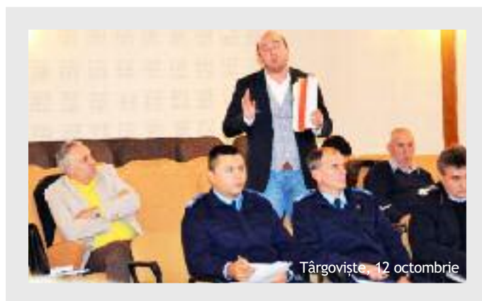
Târgoviște, 12 octombrie