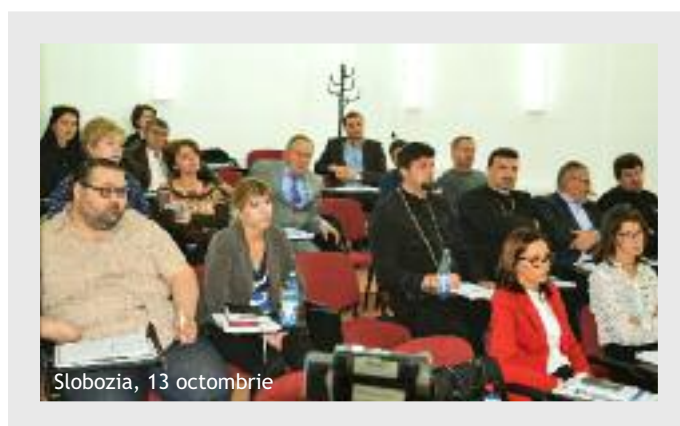
Slobozia, 13 octombrie