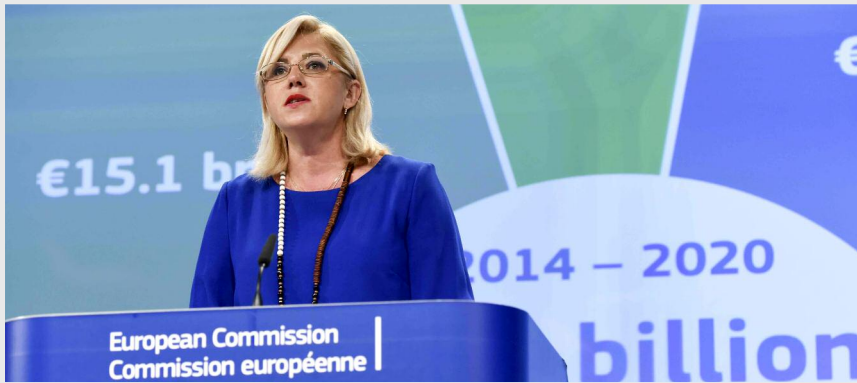
Corina Crețu, comisarul regional pentru politică regională