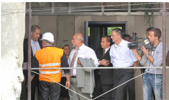
3. „Achiziționarea unor utilaje și echipamente pentru creșterea productivității și competitivității economice a societății TOYLAND INTERNATIONAL S.R.L.”;