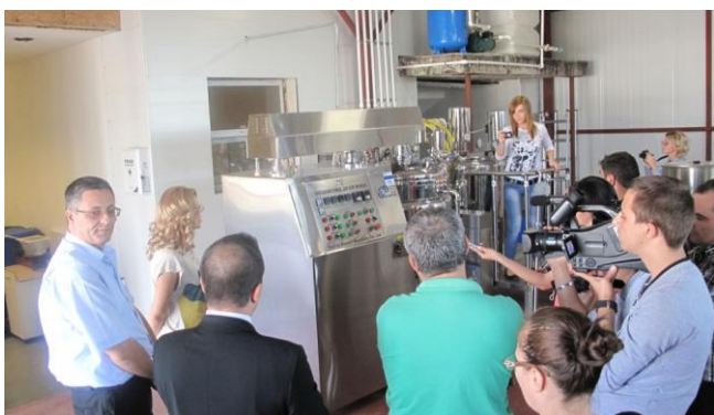
4. „Igienă și confort, necesitate zilnică” - beneficiar SoftSense S.R.L.